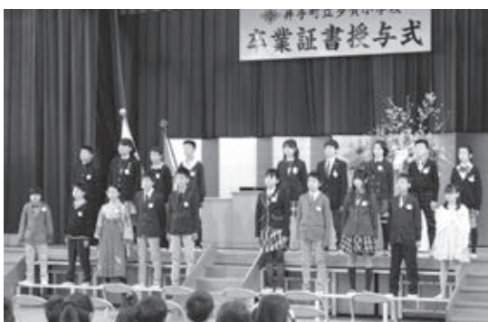
答辞を述べる卒業生（多賀小）