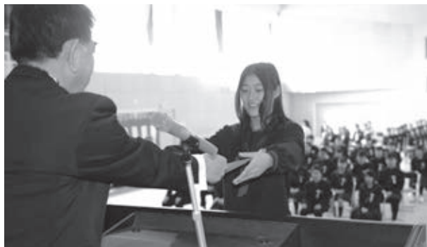
卒業証書を受け取る卒業生