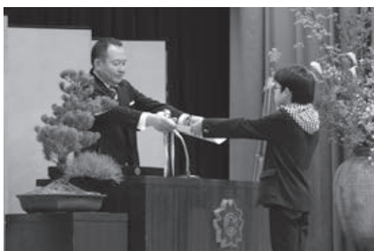
卒業証書を受け取る卒業生（井手小）