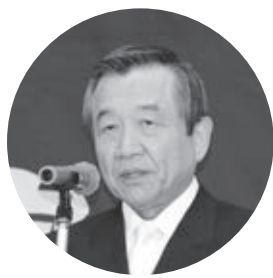
祝辞を述べる汐見町長