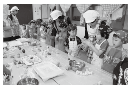
しんこだんご作りに挑戦する園児たち

園児たちは、地元の生活研究グループのメンバーから作り方を学びながら、パンダやカブトムシ、恐竜など思い思いの形に仕上げていました。