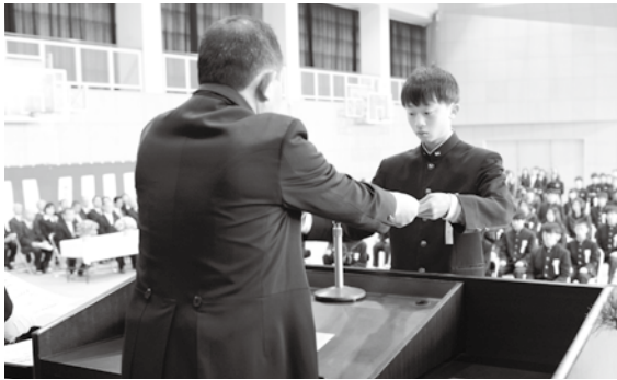
卒業証書を受け取る卒業生（泉ヶ丘中学校）