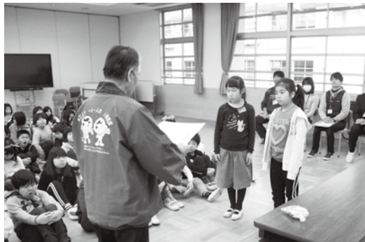
井手小学校で行われた「人権の花」贈呈式

贈呈式では、人権擁護委員の皆さんが紙芝居を披露したほか、児童への感謝状や記念品を手渡しました。児童たちが育ててきたスイセンの花は、役場や図書館などに届けられました。