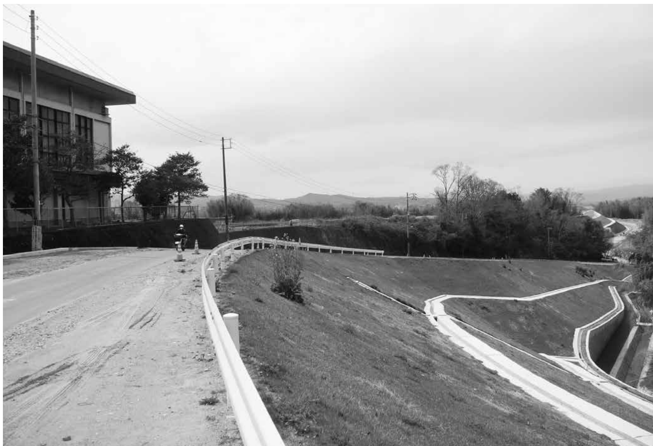
府立特別支援学校の開校に向けて整備を進める町道