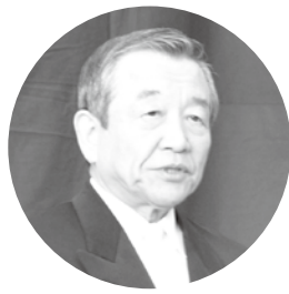
祝辞を述べる汐見町長