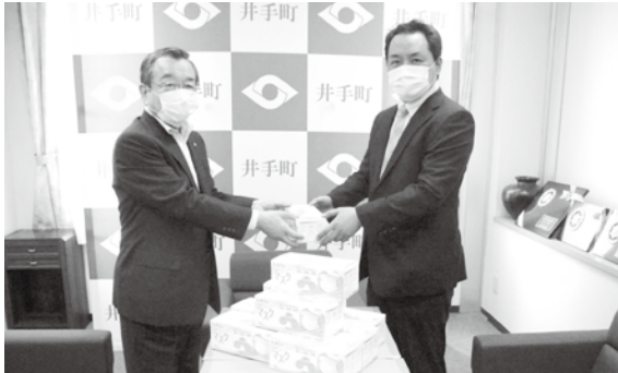
エールエンジニアリング様