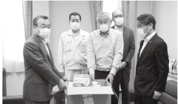
井手町チャリティーゴルフ大会実行委員会様