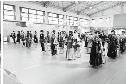
井手小学校で行われた卒業式