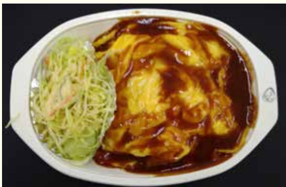
日替わり弁当の一例「オムライス」