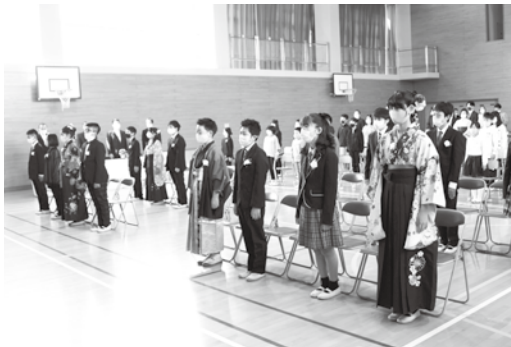
多賀小学校で行われた卒業式