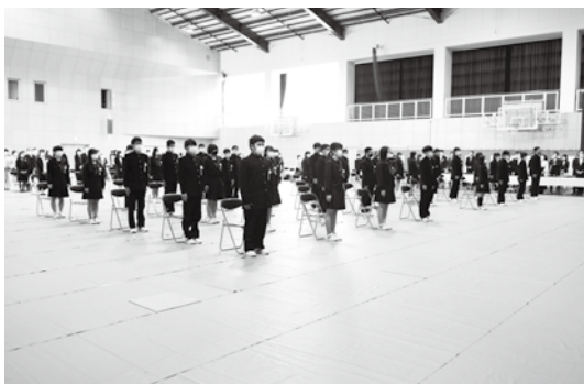
泉ヶ丘中学校で行われた卒業式

卒業式は、新型コロナウイルス感染症防止のため、今年も出席者が制限され、時間も短縮して行われました。