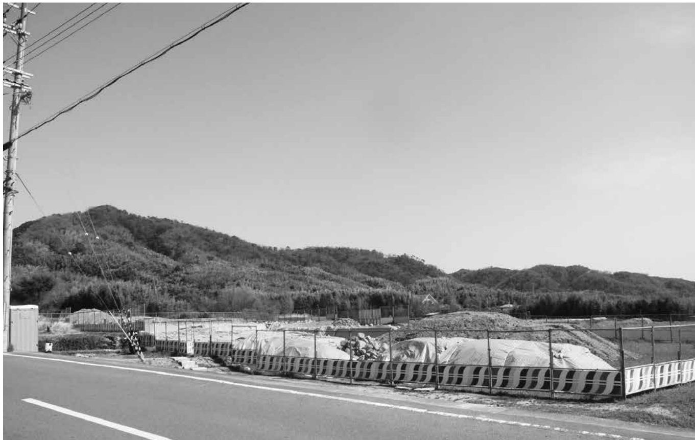
新庁舎の建設予定地