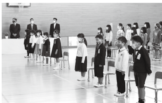
多賀小学校の入学式