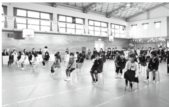
井手小学校の入学式