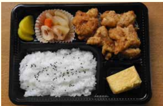
日替わり弁当の一例「鶏のから揚げ」