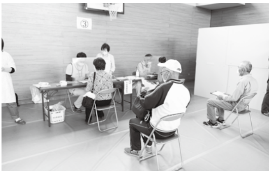
ワクチン接種会場の様子様(4月22日のシミュレーションより)

井手町は、一般高齢者に対する新型コロナウイルスワクチンの集団接種を、5月8日(土)から開始しました。初日は、町立多賀小学校体育館を会場に実施し、対象者90人が1回目の接種を終えました。また町内外の診療所での個別接種も、5月10日(月)からスタートしています。