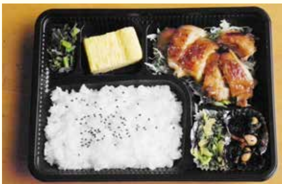
日替わり弁当の一例「鶏の照り焼き」