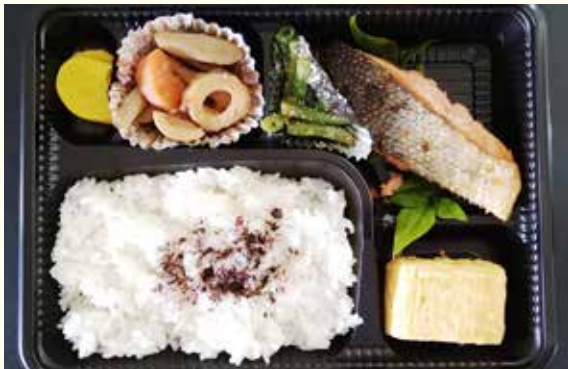
日替わり弁当の一例「和定食」