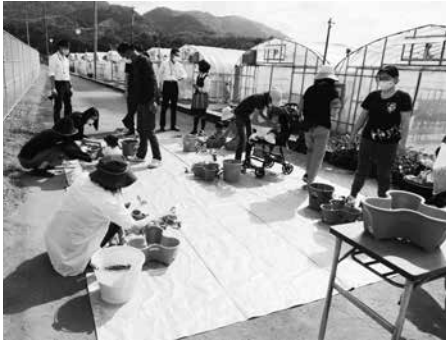
イチゴの苗を植える参加者の皆さん

ムの方から品種や育て方のポイントを教わりながら、2種類のイチゴの苗をプランターに植えつけていました。