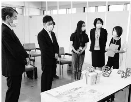
玩具の贈呈式のひとコマ