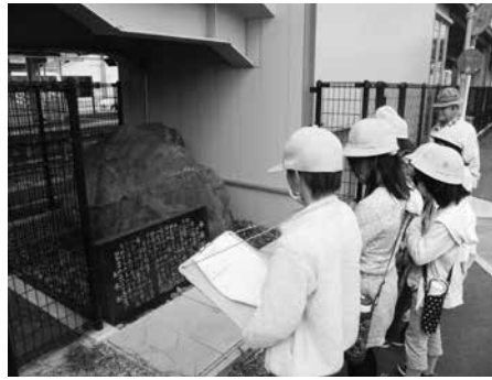
JR 玉水駅で巨石などを見学する児童たち

107人もの命を奪い、本町に壊滅的な被害をもたらした昭和28年の南山城水害について学ぼうと、多賀小学校の4年生が10月19日（火）、JR 玉水駅付近の玉川沿いを歩く校外学習を行いました。