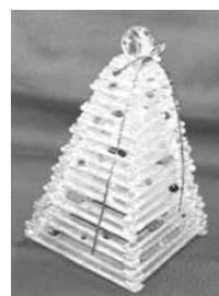
※底辺一辺約10cm、高さ約15cm