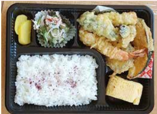
日替わり弁当の一例「天ぷら」

営業時間 午前9時～午後4時半 定休日 日曜・祝日 (TEL 0774-82-3174) 年始は1月6日(木)より営業します。