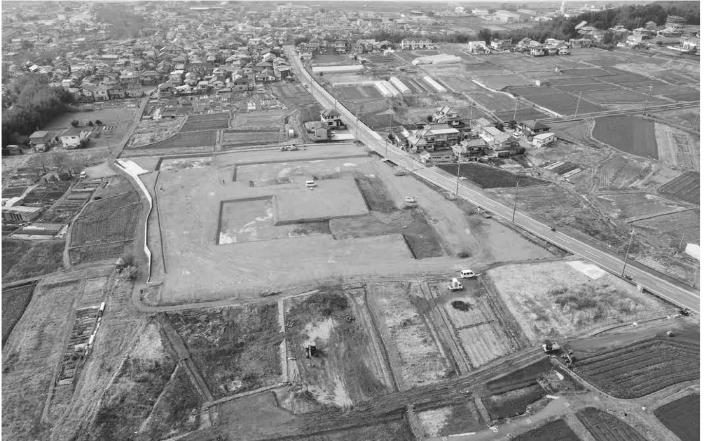
造成工事が進む新庁舎の建設地