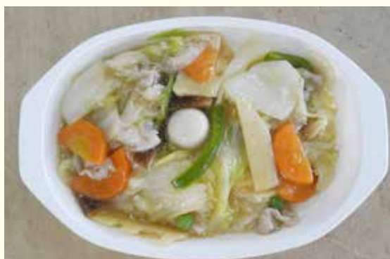
日替わり弁当の一例「中華丼」