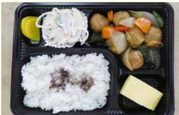
日替わり弁当の一例「甘酢肉団子」