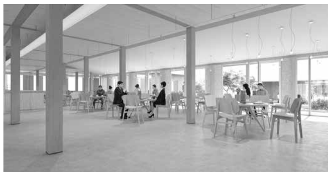
カフェエリアのイメージ