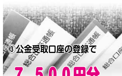
③公金受取口座の登録で