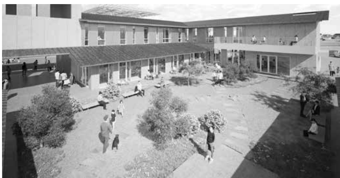
南東から見た庭のイメージ