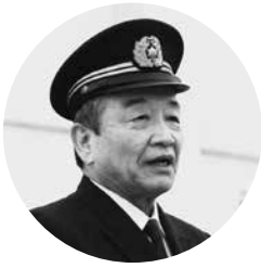
あいさつする汐見町長