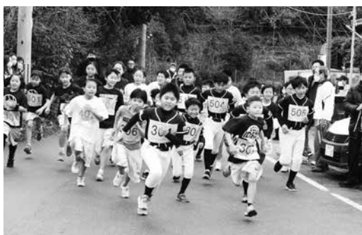
元気にスタートする選手の皆さん