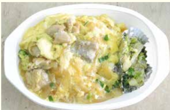
日替わり弁当の一例「親子丼」