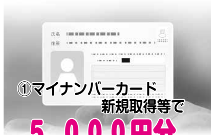
①マイナンバーカード 新規取得等で