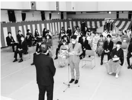
自然休養村管理センターで行われた二十歳のつどい