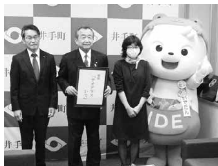
愛称の発表と最優秀賞受賞者の表彰

新しい施設にはテラスがあると聞いています。多くの方が集まってリフレッシュできるような魅力的な場所になるとともに、地域の方々をはじめ、多くの方の行く手を照らすような、希望あふれる場所になるよう願っております。