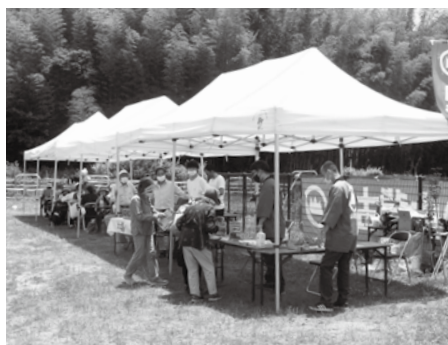
新緑の山背古道を歩き、ゴールする参加者の皆さん

木津川右岸の山際を通る散策道・山背古道を、城陽市と木津川市から井手町を目標して歩く催し「山背古道 春のはくふうウォーク」が、5月28日（日）に行われ、計約410人が、新緑映える山城地域の風景を楽しみました。