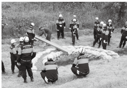
水防工法などを確認する団員の皆さん

訓練には、団員をはじめ、消防・役場職員ら約140人が参加し、汗だくになりながら、真剣な表情で各種水防工法の確認に励んでいました。