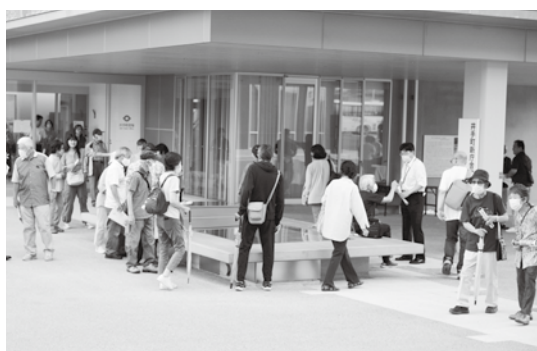
多くの人出でにぎわった内覧会

面玄関前でテープカットが行われたほか、午後からの内覧会には住民の方々の約500人が来場され、大いに賑わいました。新しい役場は、鉄骨造地上3階建、延床面積約3760平方メートル。1階には住民福祉課、保健医療課、高齢福祉課、税務課、