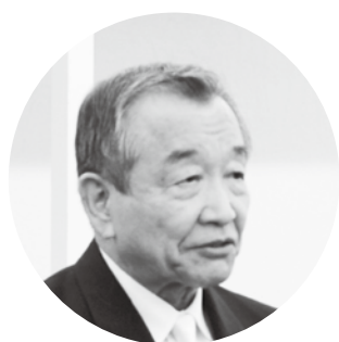
竣工式典であいさつする汐見町長