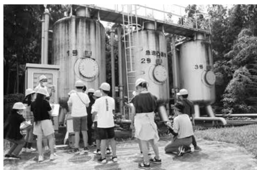
井手浄水場を見学する井手小の児童たち