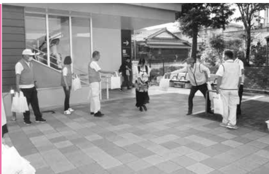
社会を明るくする運動の駅前啓発（玉水駅）

駅前啓発のあとには「社会を明るくする運動」を啓発するため町内へのパレードが実施され、運動への理解と協力が呼びかけられました。