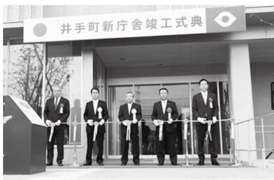
竣工式典で行われたテープカット

面玄関前でテープカットが行われたほか、午後からの内覧会には住民の方々の約500人が来場され、大いに賑わいました。新しい役場は、鉄骨造地上3階建、延床面積約3760平方メートル。1階には住民福祉課、保健医療課、高齢福祉課、税務課、