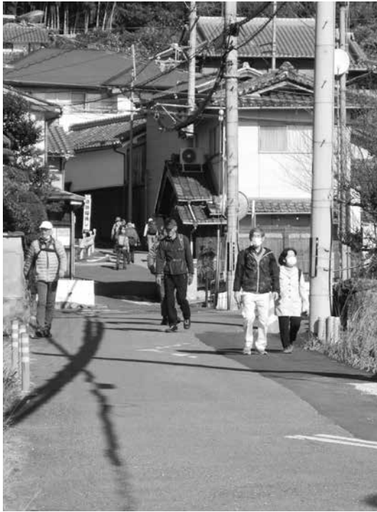
ウォーキングを楽しむ参加者の皆さん

城陽市から木津川市までの木津川右岸の山際を通る散策道・山背古道で11月26日(日)、第29回山背古道とことんウォーキングが開かれ、約470人が秋深まる山城地域の風景を楽しみながら歩かれました。 歴史遺産や里山の景観といった木津川右岸地域の魅力を楽しんでもらおうと、城陽市と木津川市、井手町の3市町で構成する山背古道推進協議会が主催するウォーキングイベントです。 参加した方々は、総延長約25キロの山背古道を、JR城陽駅前と木津川市役所前からスタートし、それぞれ思い思いのペースで歩きながら反対側のゴール会場を目指しました。 中間地点となる井手町では、今回、「まちづくりセンター椿坂」と合わせて9月に山吹ふれあいセンター1階にオープンした「テオテラスいで」前を「ホットコーナー」として設定。訪れた参加者たちがのどかなひと時を楽しんでおられました。