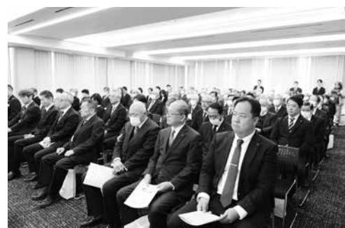
南山城水害70周年式典の式典会場

玉川、南谷川、洪川が各地で氾濫。さらに玉川の上流域にある大正池と二ノ谷池のふたつのため池が決壊し、それに伴う土石流が市街地を襲い、当時の町は壊滅的な被害を受け、死者・行方不明者は109人にのぼりました。