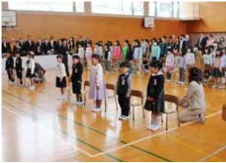
多賀小学校の入学式

新1年生は、上級生や保護者の皆さんからの大きな拍手の中、少し緊張しながらも元気よく入場しました。担任の先生から名前が