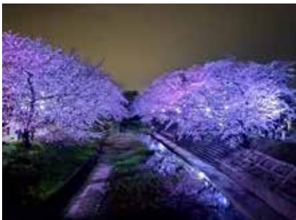
ライトアップされた玉川の夜桜