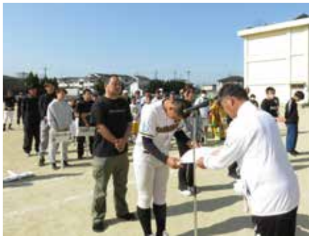
総合開会式のひとコマ

井手町のスポーツ活動の普及・振興、町民の体力と健康の増進、そして、町民の親睦と交流を一層進めていくことを確認しました。 式の中では、昨年度に顕著な活躍をした団体、個人に表彰を行いました。 また開会式後の町長杯争奪ソフトボール大会では、山吹野球クラブ保護者・泉ヶ丘中学校・東部区の3チームが同率優勝となりました。 表彰された方々は次の通りです。(敬称略)