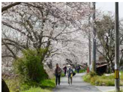
多くの花見客が訪れた桜の名所・玉川