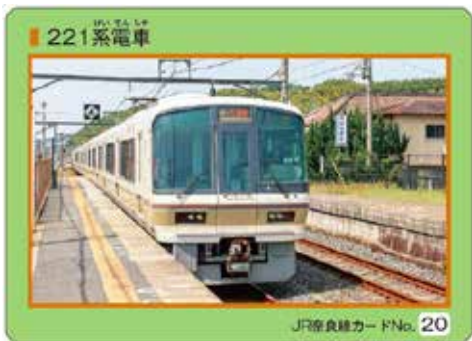
カード表面 (No.20) 221系電車