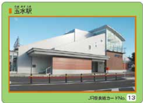
カード表面 (No.13) 玉水駅

JR奈良線高速化・複線化第二期事業の開業を記念して、井手町をはじめとする沿線自治体(京都市、宇治市、城陽市、木津川市、奈良市、宇治田原町、井手町)で構成するJR奈良線複線化促進協議会が、JR奈良線の駅や観光地等をテーマにした全20種類のJR奈良線カードを発行しましたところ、大変好評であったことから、この度、カードを増刷するとともに、カードを収納できるカードフォルダを作成しました。