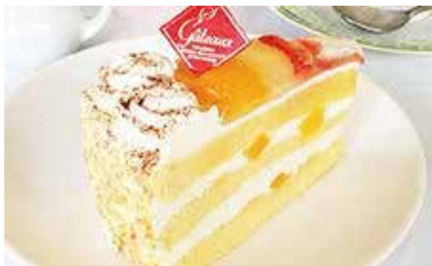
「フルーツショート」