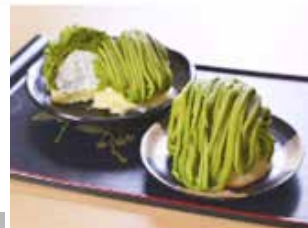
「八女抹茶モンブラン」