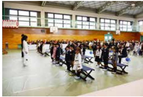
井手小学校の入学式

1人ずつ呼ばれると、新1年生の元気な返事が会場に響きました。今年の新1年生は、井手小学校が29人、多賀小学校が9人です。