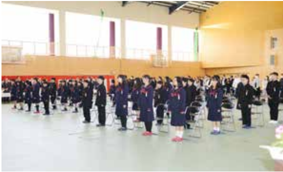
泉ヶ丘中学校の入学式