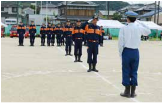
町長査閲に臨む団員の皆さん