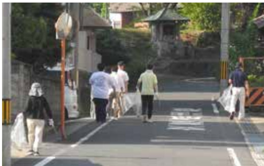
美化運動に取り組む住民の皆さん

今回も、各地域で多くの住民の方々が団体関係者の皆さんが参加し、ごみ袋やゴミはさみなどを手に、空き缶やたばこの吸い殻といったポイ捨てされたごみなどを拾い集めました。