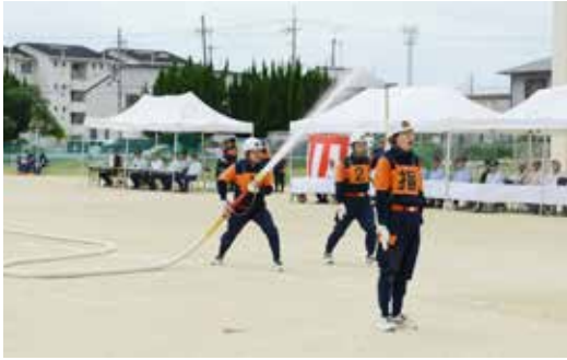
披露された小型ポンプ操法

また講評では、操法訓練と合わせ約3カ月間に及ぶ夜間訓練の取り組みをねぎらい「本日は、大変暑い中、団員の皆様が最後まで真剣に取り組まれる姿を拝見し、大変心強く思う」とも、本日の町長査閲の目的は十分に達成できたものと確信しました」と述べました。