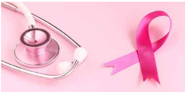
表 受けておきたいがん検診 ※費用／全て無料で受けられます