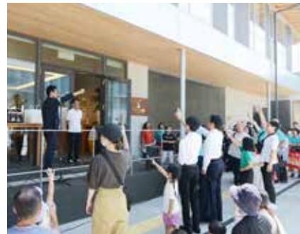
盛り上がったじゃんけん大会

ラダンスなどが披露されたほか、カフェでは限定のランチメニューなども提供されました。