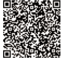
「家庭ごみの分け方・出し方」