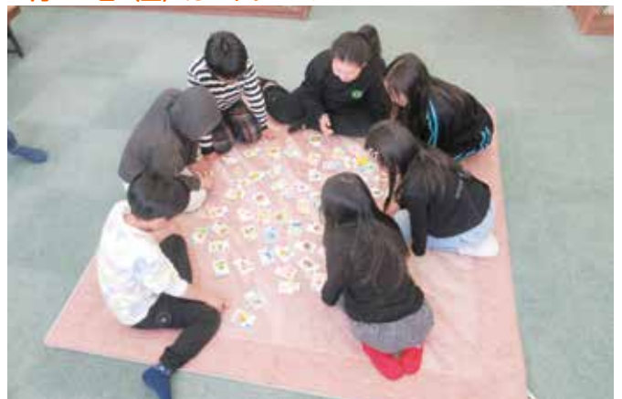
カードゲームの様子