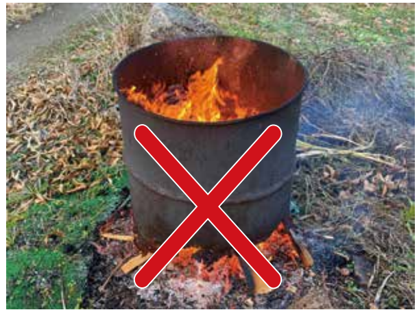
産業環境課 (Tel 82-6168) 京田辺市消防署井手分署 (Tel 82-3000)

「火災とまぎらわしい煙又は火炎を発生おそれのある行為の届出書」は、煙や火炎が火災ではない届出であって、廃棄物の焼却を消防署が許認可等するものではありません。