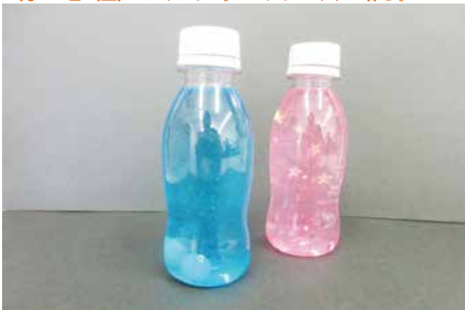
5月23日(土) スポレク (センサリーボトル作り) 見本