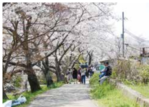
多くの花見客でにぎわう玉川堤

第35回井手町さくらまつりが、3月28日（土）から4月5日（日）まで開かれ、今年も多くの花見客でにぎわいました。 さくらまつりは、井手町商工会や井堤保勝会をはじめ、町内各種団体で組織する「さくらまつり実行委員会」が開いているイベントで、玉川堤では休憩所などが設けられたほか、夜桜の