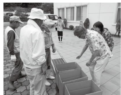
施設にジャガイモを届ける皆さん