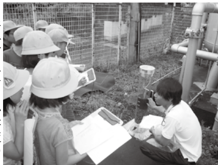
職員の説明に熱心に耳を傾ける児童たち

井手町立多賀小学校の4年生15人が6月9日(火)、同町多賀浄水場を見学し、水道の役割や仕組みについて学習しました。 児童たちは「この浄水場はいつからありますか」「どうしてここに浄水場を作ったのですか」など、担当の職員に熱心に質問していました。 6月15日(月)には、井手小学校の4年生も井手浄水場の見学に訪れました。