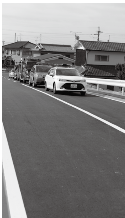
供用開始した新町道を試験走行する車両

行が困難だったことから整備しました。延長は約100メートル、幅員は7メートル。供用開始の日には、無火災デー防火パレードが行われ、早速役場の防災広報車や消防署井手分署の消防車などの緊急車両が試験通行を行いました。