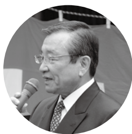
あいさつする汐見町長