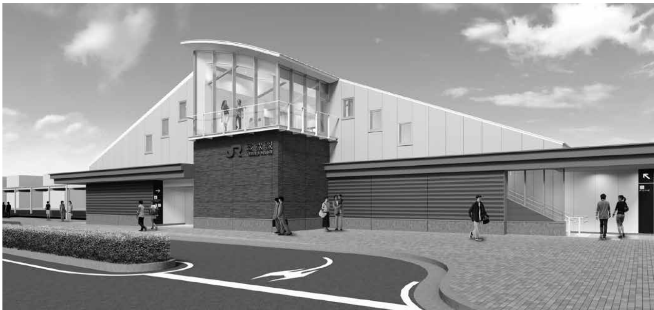
新しくなる JR 玉水駅外観のイメージ