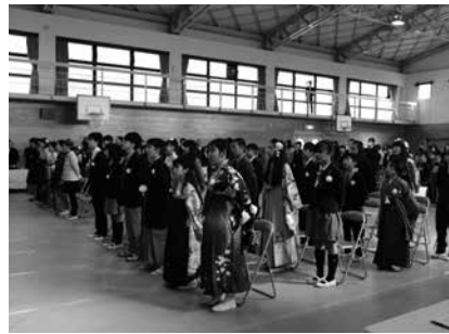
井手小学校の卒業式

それぞれの会場では、校長先生から一人一人に卒業証書が手渡されたあと、卒業生たちは、多くの人たちに見送られ、6年間の思い出を胸に小学校を巣立っていきました。