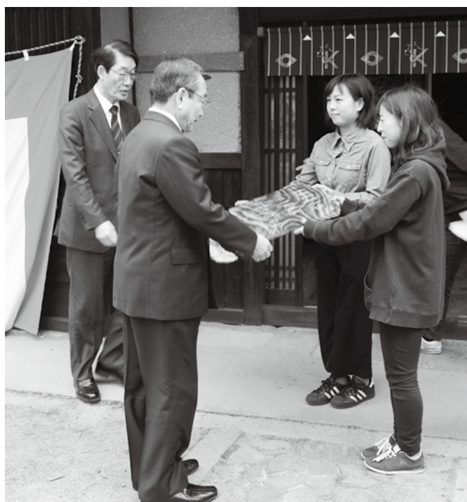
学生たちから施設の銘板を受け取る汐見町長と大城学長（左）