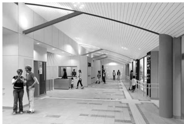
橋上駅舎の改札口付近のイメージ

その結果、一般会計予算は 45 億 1 9 0 0 万円となり、前年度と比較して 3 億 8 0 0 万円、7・3%の増額となりました。また、特別会計（国民健康保険・介護保険・後期高齢者医療・井手町水道事業・多賀地区簡易水道事業・公共下水道事業・多賀財産区）を合わせた予算総額は、74 億 8 0 0 9 万 4 千円（対前年度比 3 億 7 2 0 0 万 2 千円、5・2%増）となりました。