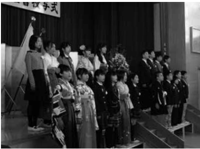
多賀小学校の卒業式