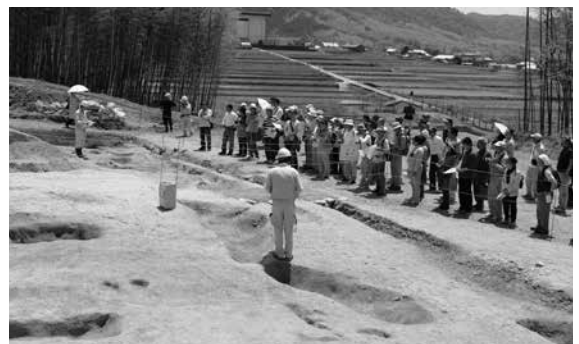
発掘現場を見学する考古学ファンの皆さん