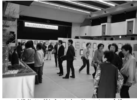
来場者でにぎわうふれあいギャラリーの会場

4月22日(土)、23日(日)の2日間、自然休養村管理センターホールで井手町文化協会の合同作品展「第7回ふれあいギャラリー」が開かれました。