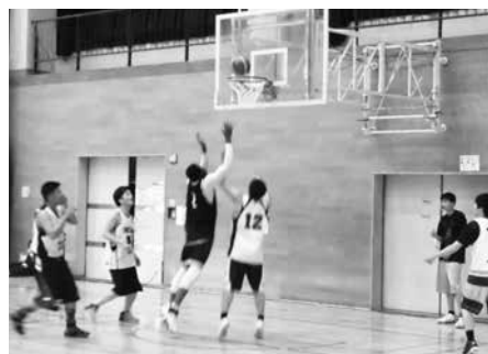
熱戦を繰り広げる選手の皆さん

【男子の部】▽優勝〓伊右衛門▽準優勝〓カメレオン 【女子の部】▽優勝〓ジャスティス▽準優勝〓泉ヶ丘中学校(女子)