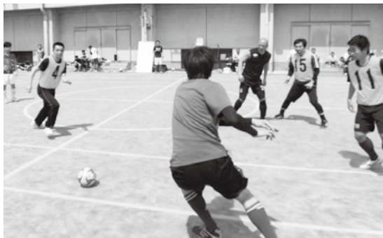
総合開会式に続いて行われた町民フットサル大会