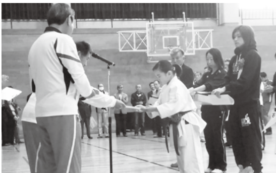
表彰を受ける選手の皆さん