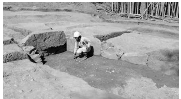
出土した横穴式石室

現地説明会には、100人を超す考古学ファンが訪れ、発掘現場を見学し、同センターの担当者の説明に熱心に耳を傾けていました。