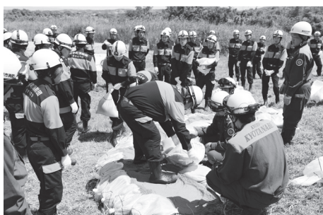
水防工法作業に汗を流す団員の皆さん

訓練では、団員たちが汗だくになりながら、真剣な表情で各種水防工法の確認に励んでいました。