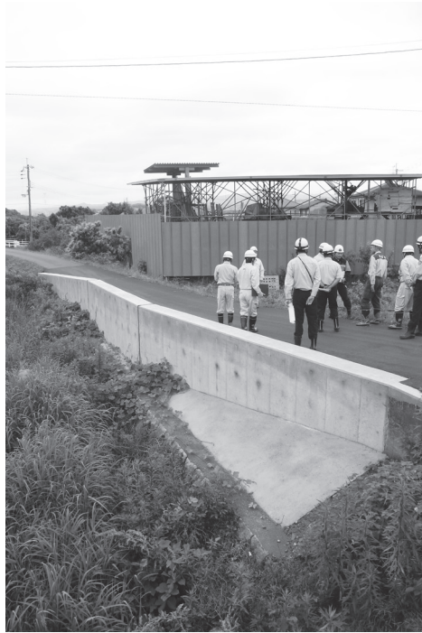
南谷川を視察するパトロール参加者の皆さん