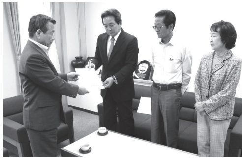
汐見町長にメッセージを手渡す皆さん

この運動は、犯罪や非行のない安全で安心な地域社会を築くことを目的に、犯罪や非行の防止と罪を犯した人たちの更生について地域の理解を深めようという取り組みです。井手町では、強調月間に合わせて街頭啓発などが行われる予定です。