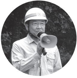
組の取組の災害対策の関関係機関に感謝を述べる汐見町長

井手町は6月8日(木)、京都府や関係機関と合同で防災パトロールを実施し、豪雨などによる災害発生への恐れがあ