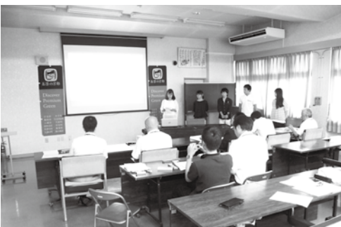
選考会でアイデアを発表する学生たち

選考会では、学生たちが「平成の名水百選」に数えられる玉川や、橋諸兄ゆかりの六角井戸、まちづくりセンター椿坂などをイメージしたり、カジカガエルをあしらったデザインの花室など、趣向を凝ら