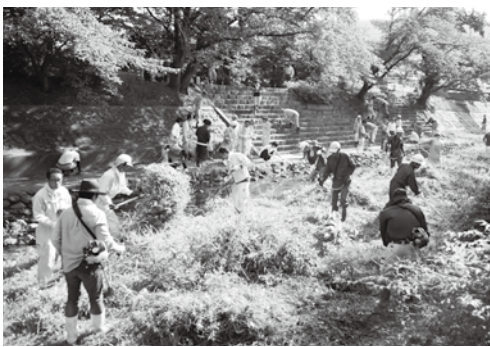
玉川の除草作業に励む参加者の皆さん

今回は、守る会を構成する8団体をはじめ、地域住民ら約130人が、奥玉川橋付近からJR跨線橋付近までの河川敷で、生い茂った草を刈り取る作業に取り組みました。