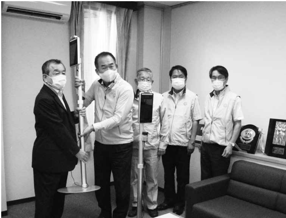
縦喜ライオンズクラブの皆様からサーマルカメラを受け取る汐見町長 1 (左)

縦喜ライオンズクラブ (久村浩会長) から9月23 日(水)、非接触で瞬時に 体温を測定できるサーマ ルカメラ6台の寄付をい ただきました。