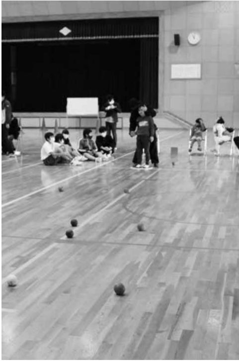
ボッチャをプレーする生徒たち

ボッチャは、重い脳性まひや身体障がいがある人のために考案されたヨーロッパ発祥のスポーツ。先に投げた白い球を目標