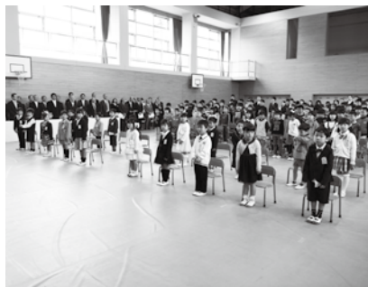
多賀小学校の入学式

新1年生は、上級生や保護者の皆さんからの大きな拍手の中、少し緊張しながらも元気づけられ、入学式に臨む新1年生の名前が1人ずつ呼ばれると、元気な返事の声が会場に響きました。今年度の新1年生は、井手小