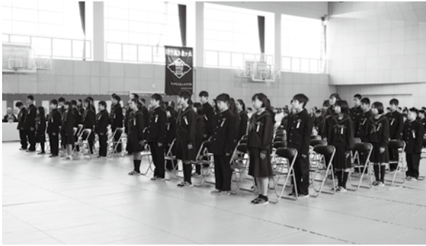
緊張した面持ちで入学式に臨む新入生たち