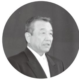
祝辞を述べる汐見町長