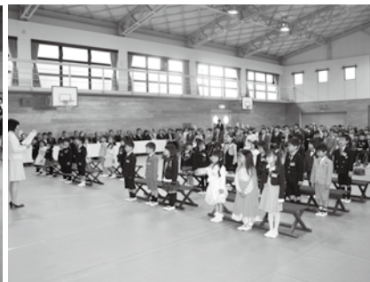
井手小学校の入学式