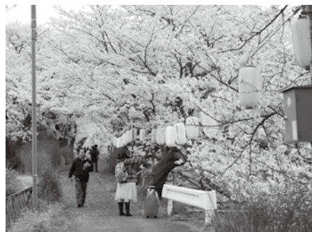
桜が満開の玉川堤

第26回井手町さくらまつりが、4月1日（土）から10日（月）まで開かれ、今年も多くの花見客でにぎわいました。