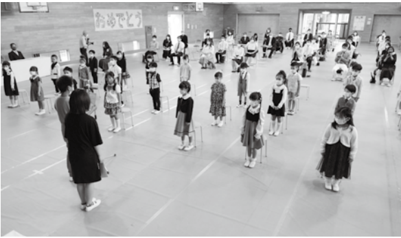
新入生に歓迎の言葉を述べる児童代表（井手小）