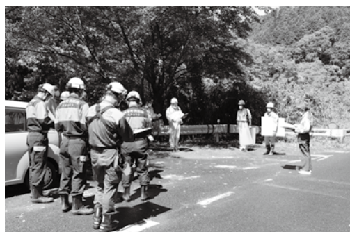
玉川上流域の斜面を視察する参加者の皆さん

井手町は6月10日（水）、 本格的な雨のシーズンを控 えて、関係機関と合同で防 災パトロールを実施し、豪 雨などによる災害発生の際 れがある危険箇所を現状 や、防災対策の状況などを 確認しました。