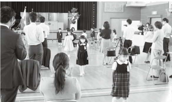
出席者に見送られ教室に向かう新入生（多賀小）