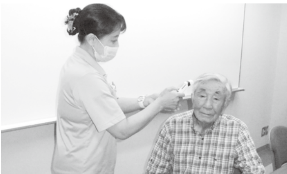
福祉施設等に配布した非接触赤外線体温計（いでりの里）